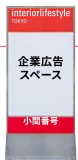
広告ボードイメージ

※入稿データ：全てアウトライン化したIllustratorファイル（CS5以下／W848×H1048 (mm)／350dpi以上） ※小間番号は事務局が別枠に用意して掲載します。 ※設置場所をご相談のうえ、調整させていただきます。