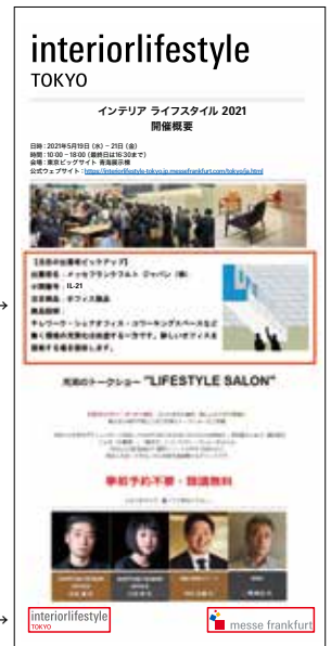
来場誘致メールイメージ