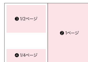
広告フォーマットイメージ