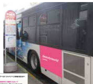
車体広告イメージ

※スポンサー枠に限りがあるため、受付は審査制とさせていただきます。 ※完全データ支給をお願いします。色校正および掲載位置・点数の指定はできません。