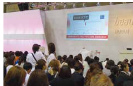
メインステージイメージ