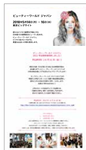
メール代行イメージ