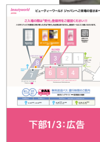
来場案内イメージ