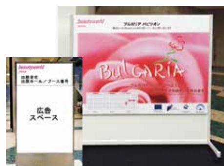
ボード(小)イメージ