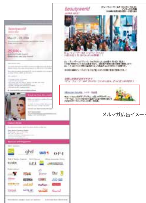
メルマガ広告イメージ