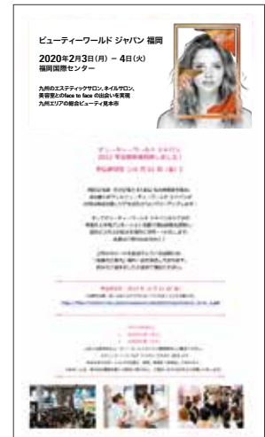
メール代行イメージ