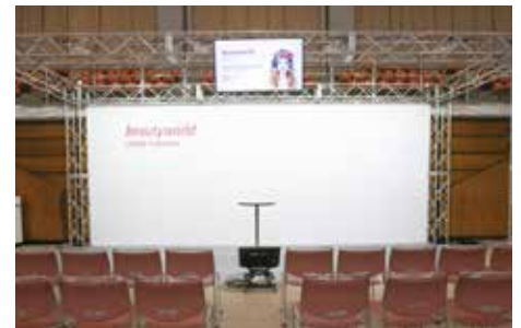
メインステージイメージ