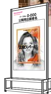
広告ボードイメージ