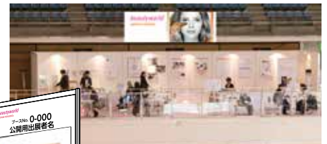
垂れ幕タイプ設置イメージ