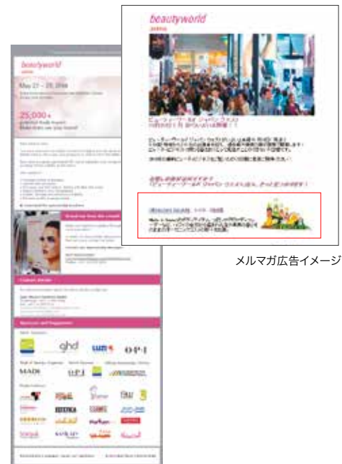
メルマガ広告イメージ